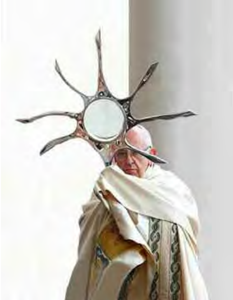
L'ostensorio indica la sovrapposizione di 7 numeri 6, ciascuno formato dal cerchio centrale con uno dei raggi. Il numero 7 volte 666 simboleggia il Sole Infinito di Lucifero .