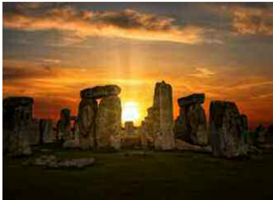
Il sole che brilla al centro del tempio celtico, nel solstizio d'estate.

Nel “Novus Ordo” di Paolo VI, l'espressione: “Dio creatore dell'Universo” è stata sostituita da quella di “Dio dell'universo” , espressione della Cabala giudaica che, con queste parole, individua non il Dio creatore dell'universo, ma il Dio immanente all'universo .