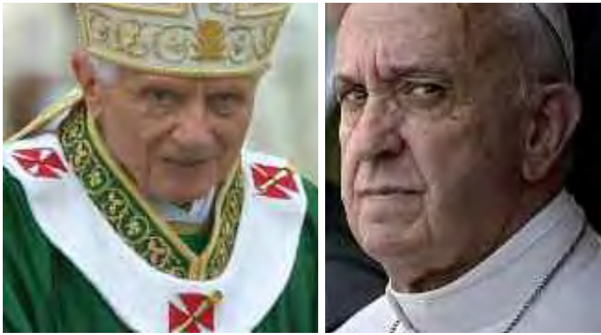
Benedetto XVI e Jorge Bergoglio che hanno ricevuto una condanna a 25 anni di prigione sono stati accusati di crimini contro l'umanità.